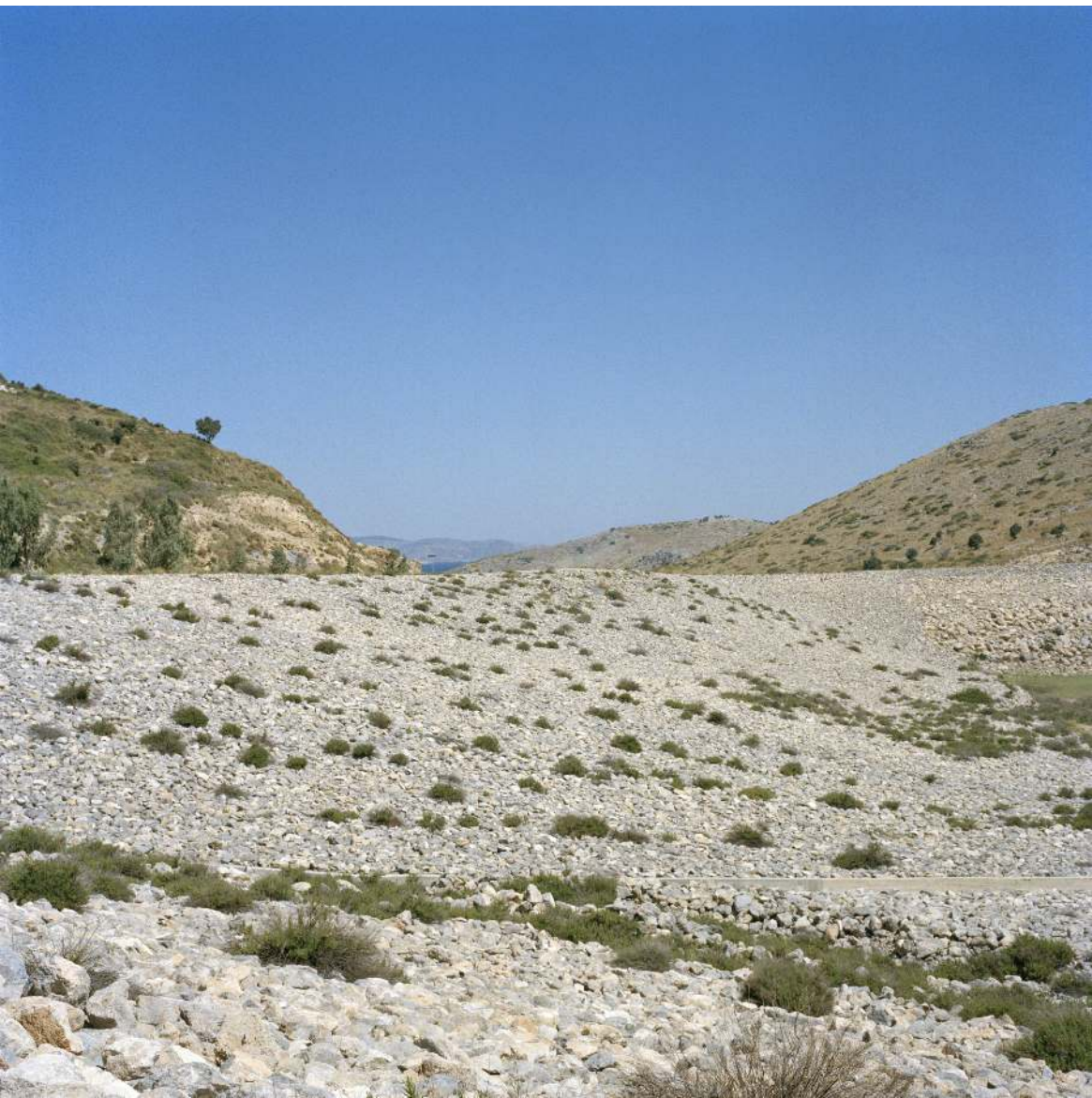
Landscape in north Leros. Restricted access, militarised zone of Partheni, Leros.