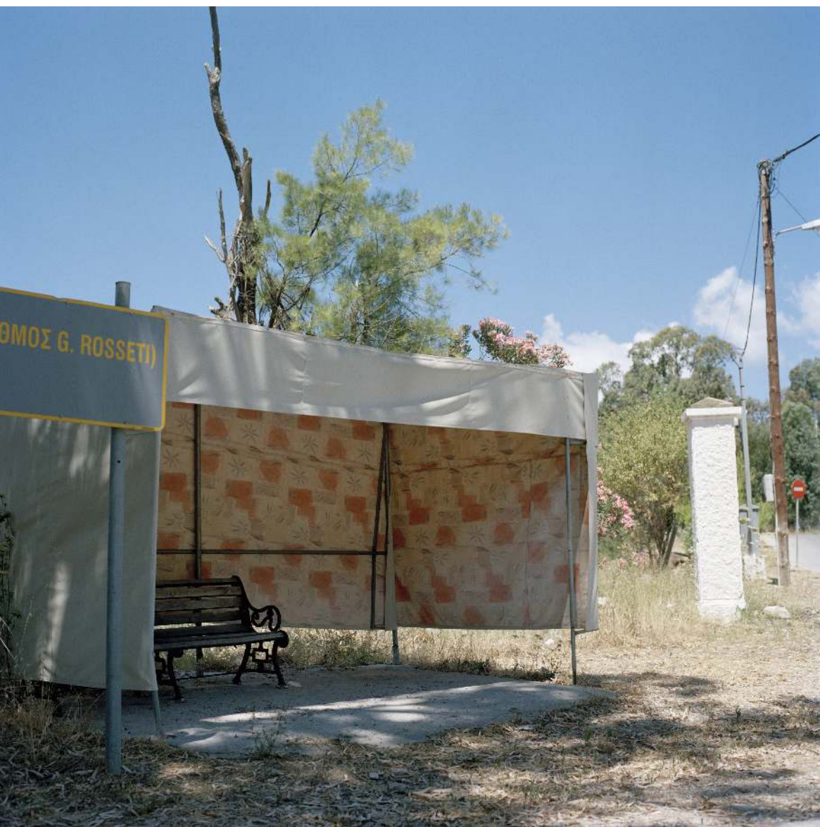
Bus stop, Xirokampos, Lepida, Leros.