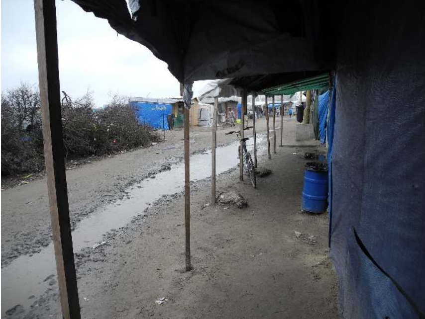
Geschäftsviertel im New Jungle.

lich, die außerhalb der informellen Macht- und Gewaltverhältnisse standen und zugleich Ausgangspunkte weiterer Interventionen waren (vgl. Calais Migrant Solidarity o.J., 2015a). Stellte bereits dies eine sichtbare Aneignung urbaner Ressourcen dar, so machten demonstrative Camps an exponierten Stellen der Innenstadt und das öffentliche Einfordern des Rechts auf Mobilität in den Jahren 2013/14 (vgl. Mörsch 2016: 213f.) unüberschbar, dass eine neuartige soziale Bewegung und Realität entstanden war, die die öffentliche Wahrnehmung der Stadt überlagerte und ›Calais‹ gleichsam neu definierte: als die Stadt mit den Jungles. All dies ließ die administrativen Routinen einer Verdrängung des ›Problems‹ an die Peripherie und in die Unsichtbarkeit ins Leere laufen und bewirkte einen Rückgriff auf Taktiken der Raumzuweisung außerhalb des städtischen Raumes, wie sie in Calais bereits in den Jahren 1999 bis 2002 praktiziert worden waren. 2