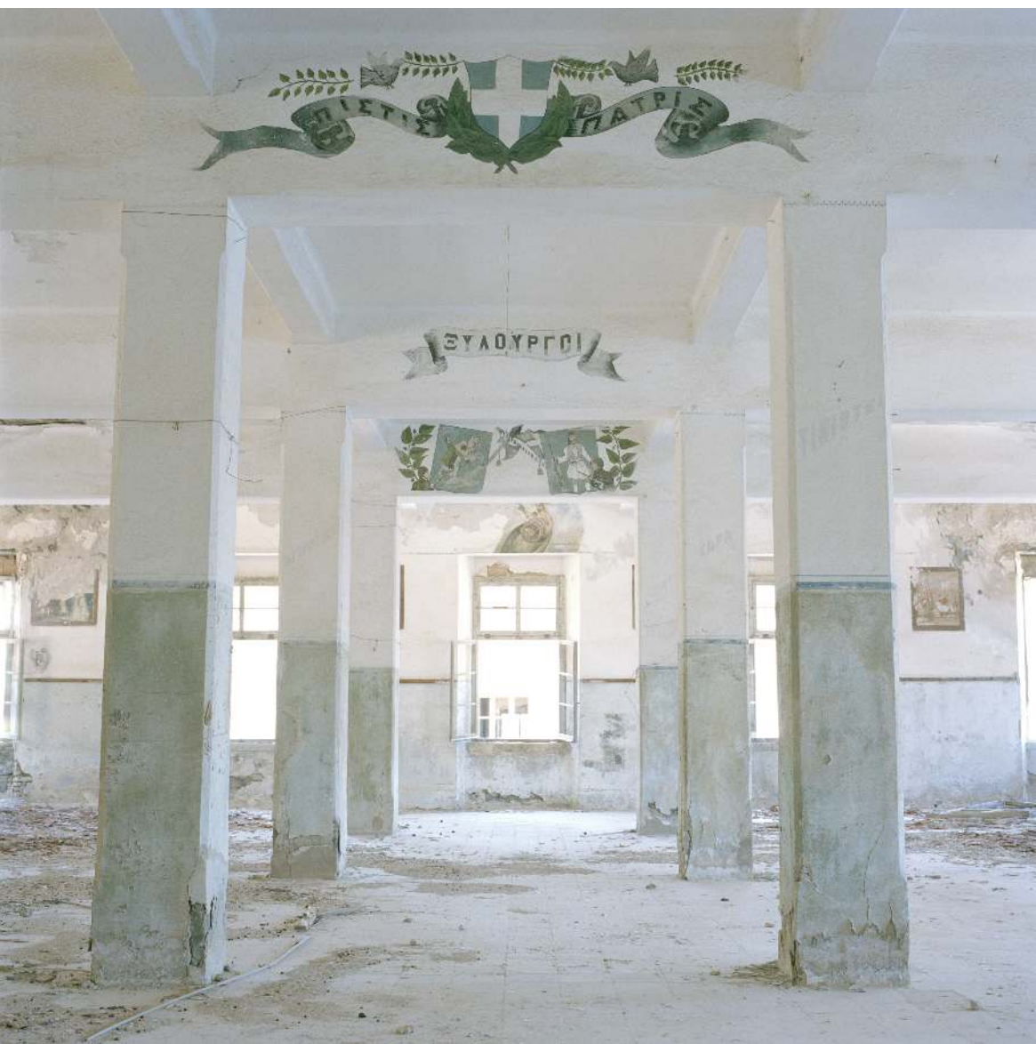
Interior of the now abandoned Royal Technical School, Lakki/Portolago, Leros.