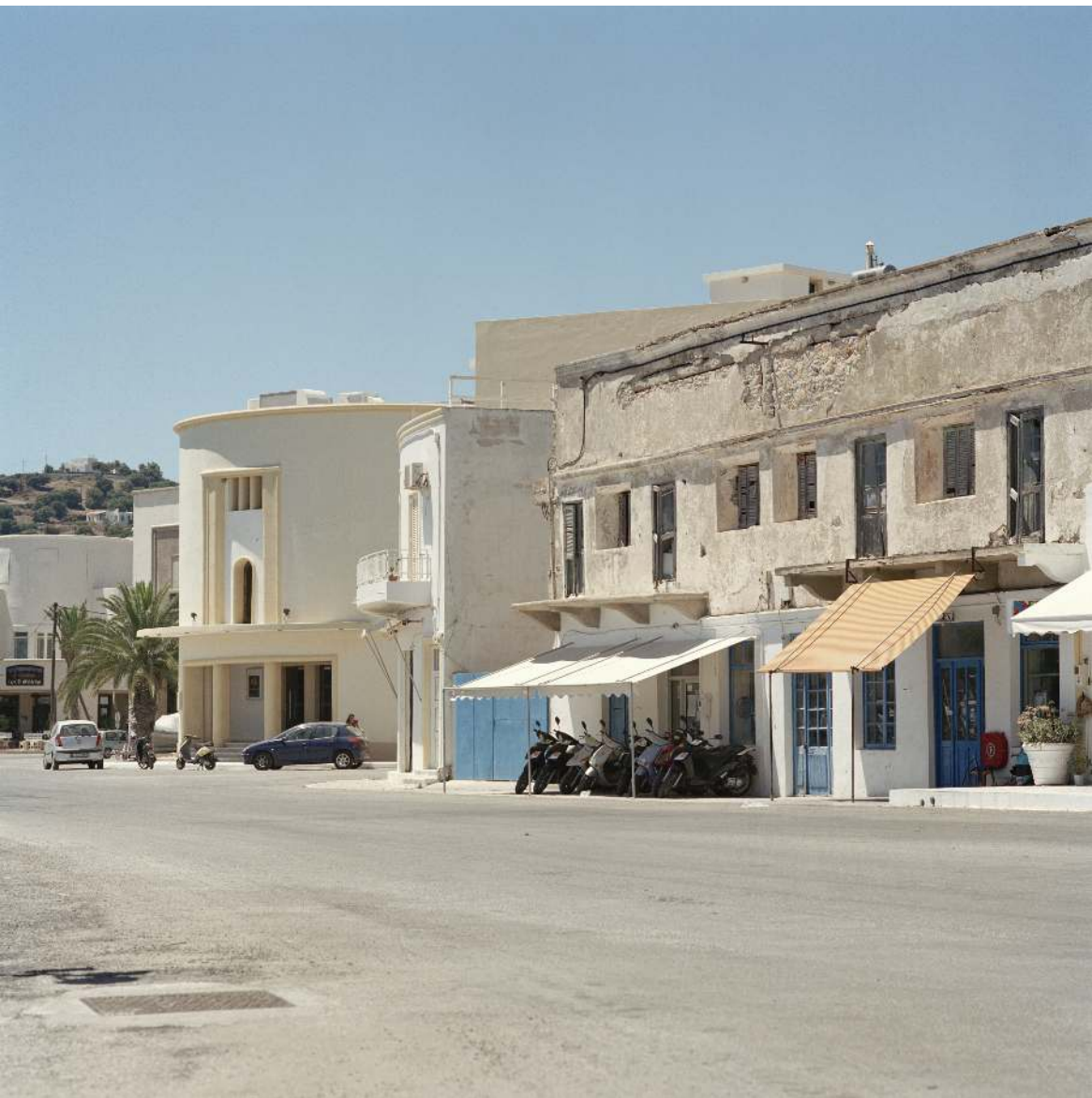
The coastal road of Lakki/Portolago, Leros.