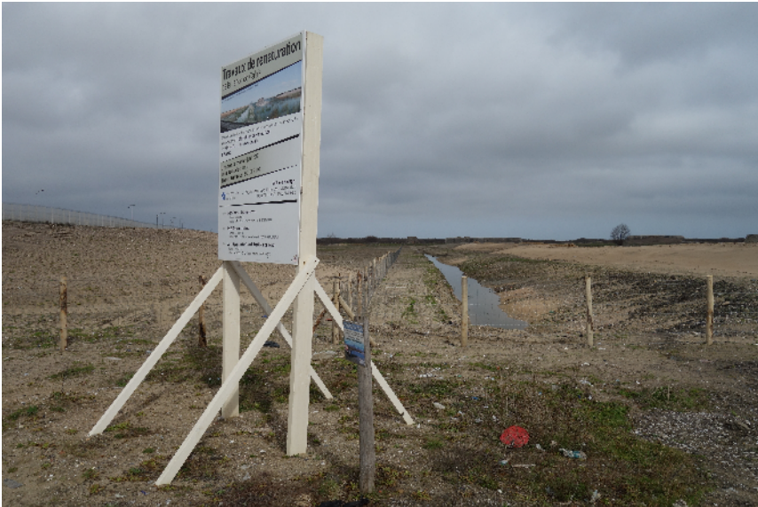
Überschreibung. Das ehemalige Gewerbeviertel des New Jungle nach Räumung, Sperrung und Neuformung der Topographie.

Gelegentlich entstehen kleine und kurzlebige Camps, die als Jungles bezeichnet werden, jedoch keine Urbanität mehr aufweisen.