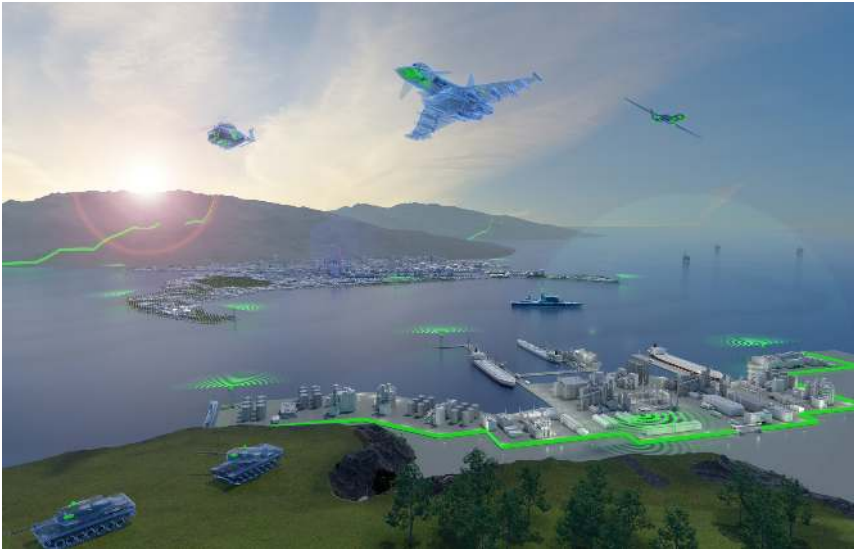
Abb. 3: Darstellung aus der Webseite von Airbus.

In den angeführten Aussagen von Beugels wird ein Verständnis von Grenzen deutlich, in dem diese in Anpassung an die Landschaft durch Technologie hergestellt werden müssen. Ebenso wird eine — auch dem Grenzüberwachungssystem EUROSUR und Hot-Spot-System zugrunde liegende — Segmentierung der Grenze deutlich: je nach Landschaft und für die Grenzpassage genutzten Mitteln, wie z.B. Booten, sind unterschiedliche Grenzabschnitte verschieden stark ›gefährdet‹. Wälder werden deshalb aktuell als besonders ›gefährlich‹ angesehen, weil die Detektion von Grenzpassagen in ihnen (für die Technologie) besonders schwierig ist. Die Gefährdung der Grenze entsteht also in dieser Logik aus einer Mischung aus Grenzpassagen, Landschaft und Technologie. Sichere Grenzen sind dann der Effekt einer guten Passung zwischen Technologie, Landschaft und Art der Grenzpassagen.