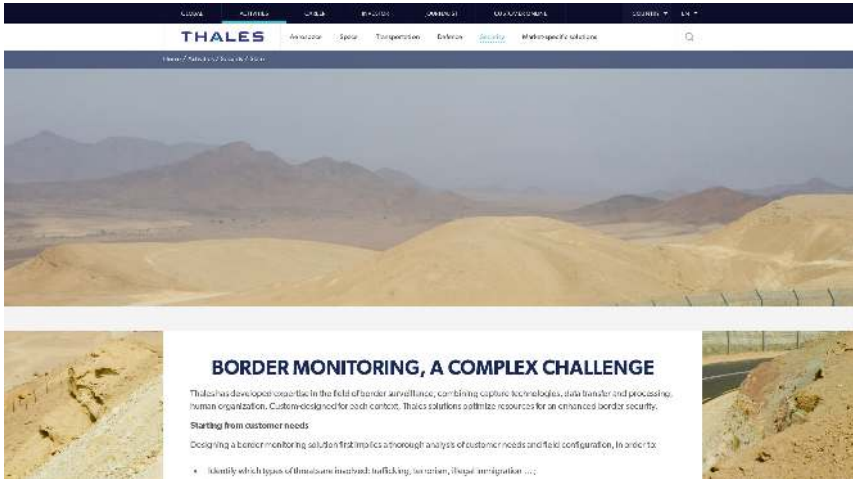
Abb. 1: Screenshot der Webseite von Thales.

ment wird Zirkulation zum Problem, aber auch zum Anliegen: Es betont Migration als normalen Prozess und ruft dazu auf, über die Kontrolle von Mobilität hinauszugehen und Migration proaktiv und zum Wohle aller zu organisieren und steuern (vgl. ebd.). Martin Geiger und Antoine Pécoud erläutern den Begriff folgendermaßen: