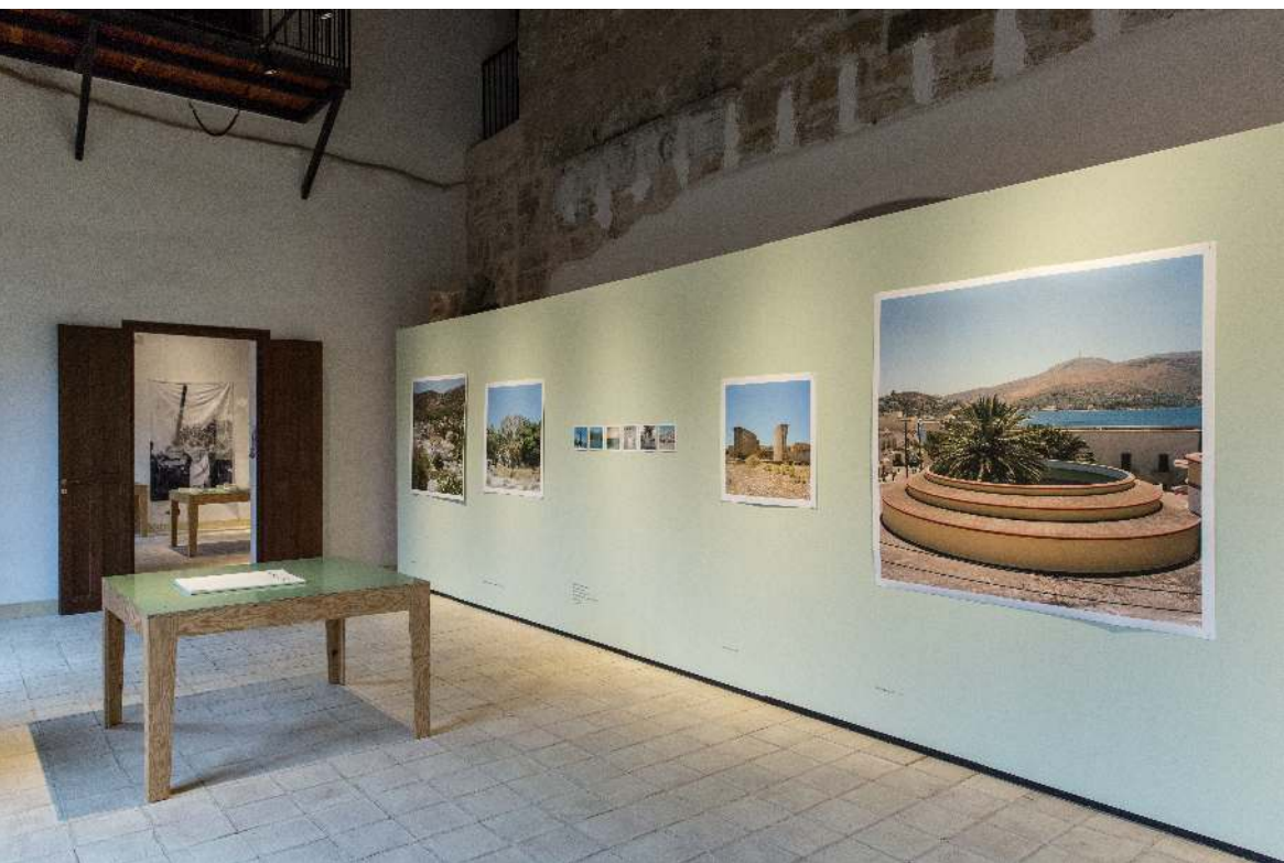
Leros: Island of Exile, Manifesta 12. Photographic prints and the book with archival material.