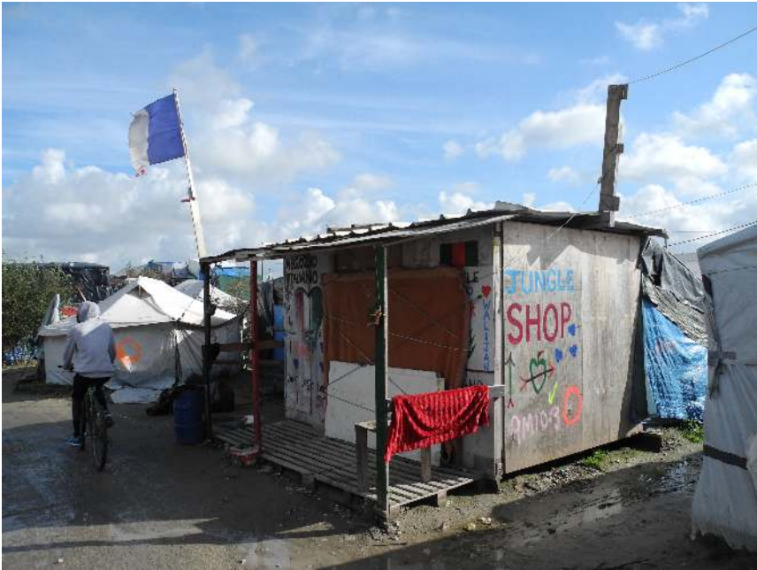
Der Jungle Shop , eine von zahlreichen Kleinhandlungen im New Jungle. (Foto: T. Müller, Oktober 2016)

Umfeld und waren der Hintergrund wiederkehrender Eskalationen, die vordergründig als ›ethnische Konflikte‹ erscheinen konnten, tatsächlich jedoch Hegemonie- und Verteilungskonflikte waren. Während der größten dieser Auseinandersetzungen wurde am 26. Mai 2016 ein gesamtes sudanesisches Viertel von afghanischen Gruppen niedergebrannt. Da solche Konflikte entlang ethnischer Linien eskalierten, war eine Konvivalität begünstigende Siedlungsstruktur, die auf räumliche Distanz aufbaute, elementar für die Reduktion von Risiken und Gewalt (Hanappe 2016c). Diese Distanz aber war mit der Verdichtung infolge des staatlichen Raumentzugs immer weniger gegeben, was die Risiken potenzierte.