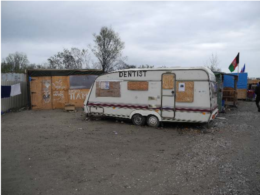
Hamam (links) und Zahnarzt im Zentrum des New Jungle. (Foto: T. Müller, April 2016)

Überstellungsfristen abwarteten, mehrere Optionen parallel verfolgten, einfach nur orientierungslos waren oder im New Jungle ein Auskommen gefunden hatten. Manche, darunter zahlreiche unbegleitete Minderjährige, erfüllten alle Voraussetzungen einer legalen Einreise nach Großbritannien, waren jedoch von den zur Realisierung erforderlichen Verfahren und Informationen abgeschnitten. Auch kriminelle Gangs hatten sich im New Jungle angesiedelt und nutzten ihn beispielsweise als Absatzmarkt für Drogen.