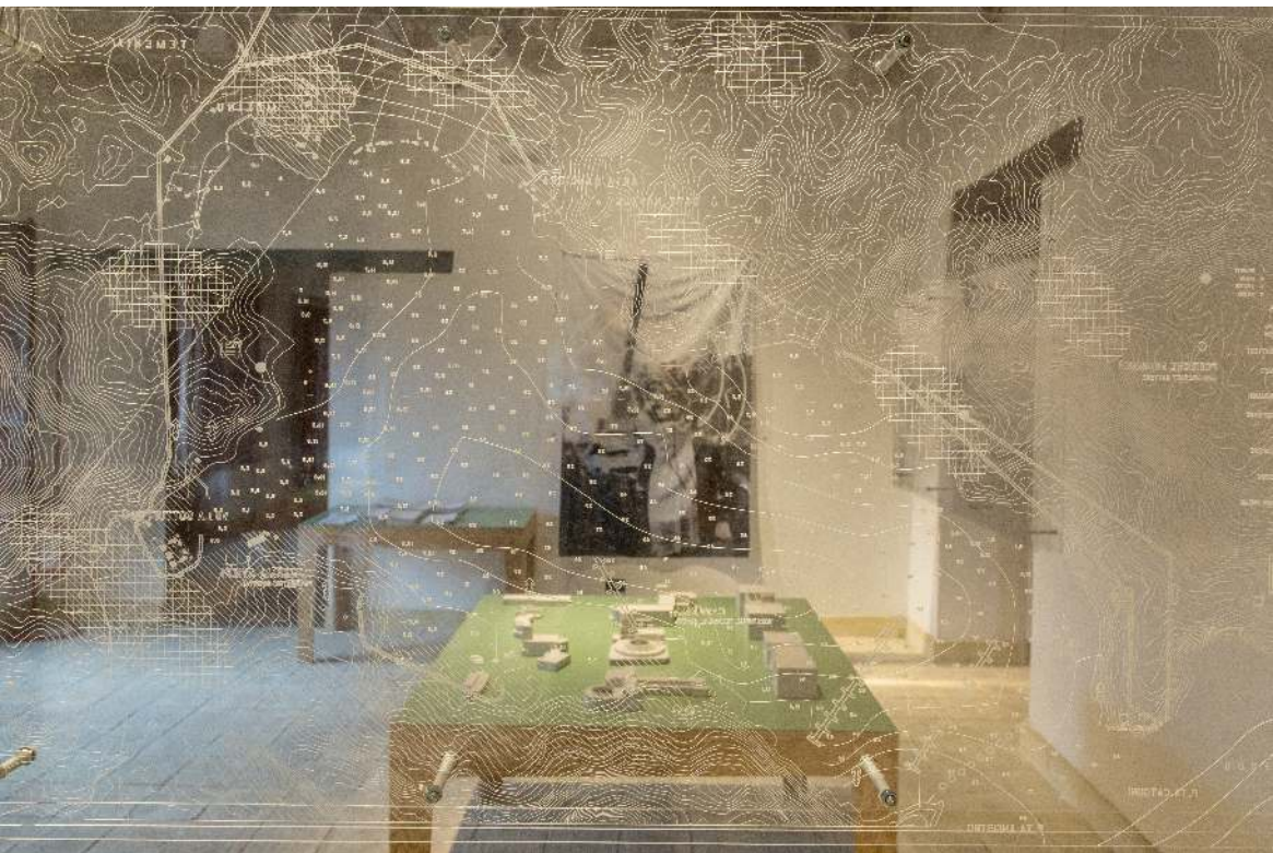
Leros: Island of Exile, Manifesta 12. Detail of a reproduced multi-layered military map from the Italian naval and army services. Material: Plexiglas.