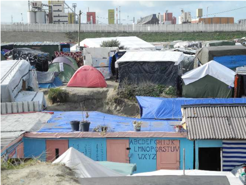
Das Zentrum des New Jungle, im Hintergrund die weißen Zäune entlang der Autobahn zum Fährhafen.

wurde. In diesem sprachlichen Muster erschien er gleichsam als leerer Raum im Zustand einer zugestandenen, jedoch namen- und formlosen (informellen) Zwischenutzung. Jungle hingegen hieß die Siedlung bei ihren Bewohner_innen, bei Aktivist_innen und Helfer_innen, bei der lokalen Bevölkerung, bei den meisten Medien und nicht zuletzt bei rassistischen und rechtsextremen Gruppen. Positiv verstanden repräsentierte der Name Jungle eine Kontinuität innerhalb einer langen Reihe aufeinander folgender oder parallel zueinander bestehender Siedlungen von Migrant_innen, die in Calais seit den späten 1990er Jahren nachgewiesen sind und seit Mitte der 2000er Jahre als Jungles bezeichnet werden.