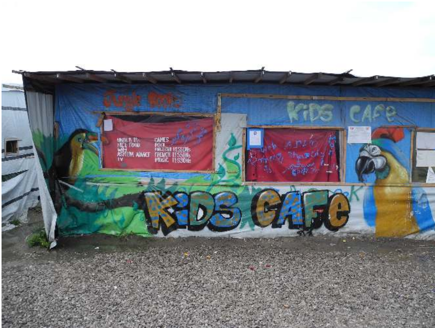
Das Kids Café im Gewerbeviertel des New Jungle war ein informelles Jugendzentrum mit kostenlosem Zugang zu WLAN, Getränken, Nahrung, Informationen und Spielen. (Foto: Oktober 2016)

der Grenzfalle nicht nur wirksam gebliebenen, sondern miteinander interagierenden mobile commons in ein hybrides Gemeinwesen: