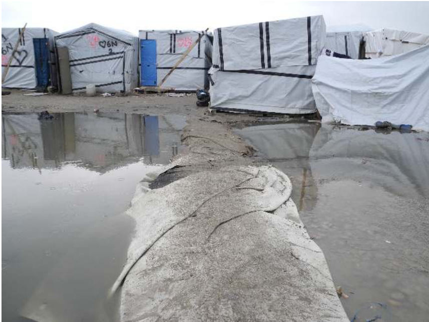
Hölzerne, durch Folien isolierte Wohnhütten im Zentrum des New Jungle. Die Nummern an den Wänden stammen aus Einwohnerzählungen, die Hilfsinitiativen mehrfach durchführten. Durch das nasse Gelände führt ein provisorischer Weg. (Foto: T. Müller, April 2016)

die Verknappung der Migrationsmöglichkeiten bei gleichzeitigem Anstieg der Zahl und Aufenthaltsdauer der Migrierenden, die Entstehung lukrativer Geschäftsfelder für Schmuggler_innen mit fließenden Übergängen zur organisierten Kriminalität und zu ausbeuterischen Ökonomien, ein massiver Anstieg der verlangten Preise, wiederkehrende Verteilungskämpfe zwischen migrantischen Gruppen, steigende internationale Medienaufmerksamkeit und die Verortung der Calais-Thematik auf höchster politischer Ebene Frankreichs und Großbritanniens — aber auch eine Pluralisierung und Professionalisierung solidarischer und humanitärer Interventionen sowie eine Anpassung der mobile commons an die Situation der Grenzfall.